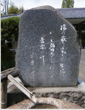
白鳥温泉 春木屋旅館の歌碑 (いわき市常磐白鳥町 春木屋旅館) 湯の嶽のふもとの出湯いこい都々 あくたらほうと孟宗の竹