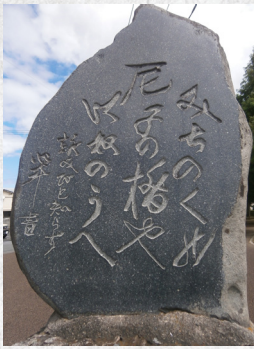
尼子の橋の句碑(いわき市平) みちのくの尼子の橋やいねのうへ 詠みびと知らず