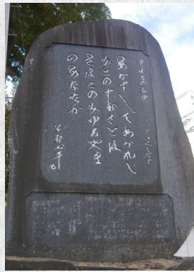
拾遺和歌集・あかずしての歌碑 (いわき市常磐湯本町 温泉神社) あかずしてわかれしひとのすむさとほ さはこのみゆるやまのあなたか