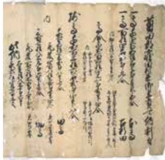
窪田地区振興会所蔵文書

江戸時代、現在のいわき市域を構成していた幕領やさまざまな藩のうち、いわき市南部を統治した磐城平藩と窪田藩にまつわる歴史を紹介します。