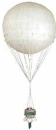
風船爆弾模型

第二次世界大戦の終結から79年。いわき市内に在住の方の学徒動員や風船爆弾基地に関する体験談から、戦時中の記憶をたどります。