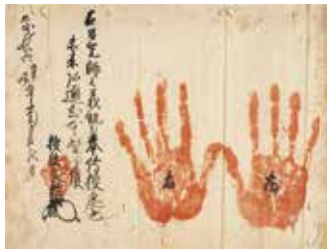
専称寺文書(福島県指定文化財・専称寺蔵)

浄土宗名越派の学問所として繁栄した専称寺(いわき市平山崎字梅福山)について、専称寺文書(福島県指定文化財)などをもとに、その歴史を解説します。