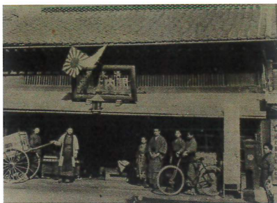
清光堂書店(清水家関内書店とも称した、大正時代)

清光堂書店は明治から昭和初期にかけて、現在のいわき市平にあった書籍文房具店です。書籍販売のほか、絵葉書や郷土資料を発行して地域の文化振興にも貢献しました。本展では、清光堂が発行した書籍や、書店を営んでいた関内家に残る資料でその歩みを紹介します。