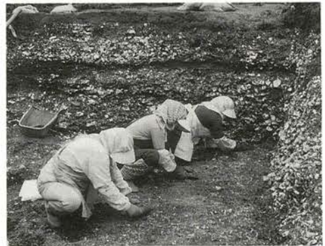
貝層調査状況（相子島貝塚）