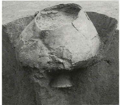
土器棺墓（五反田A遺跡）