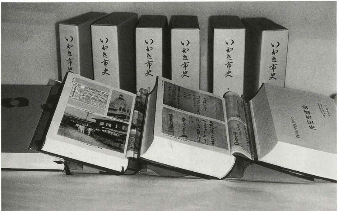
太古から現代までをつづる『いわき市史』